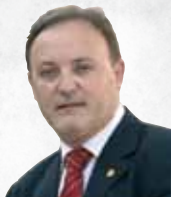
Joan Martí Pla i Pla Alcalde

Un any més l'Ajuntament de Perafort i Puigdelví engega el programa de beques i ajudes a l'estudi. Unes ajudes que pretenen ajudar a fer front a les despeses que per als nostres estudiants suposen l'adquisició de llibres, material i matrícules, així com pal·liar el cost que suposa el transport escolar.